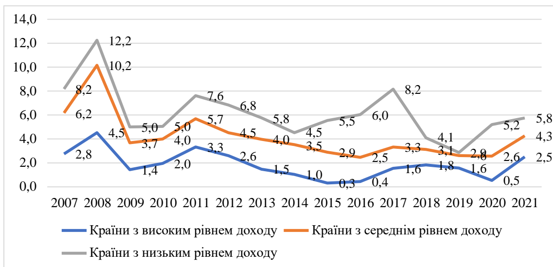
Рисунок 2. Інфляція споживчих цін по групах країн за рівнем доходу, 2007–2021 рр., у % до попереднього року

Стабільність та полегшення фінансових умов сприяло економічному зростанню, але воно також сприяло прийняттю ризику та накопиченню фінансової вразливості. Зараз, коли інфляція досягла максимумів за десятиліття (рис. 2), монетарні органи в розвинутих економіках прискорюють темпи нормалізаційної політики, щоб запобігти закріпленню інфляційного тиску та зниженню інфляційних очікувань. Це змусило центральні банки надалі ужорсточувати монетарну політику та згортати заходи підтримки економіки.