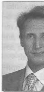
М. В. ОНИЩУК Міністр юстиції