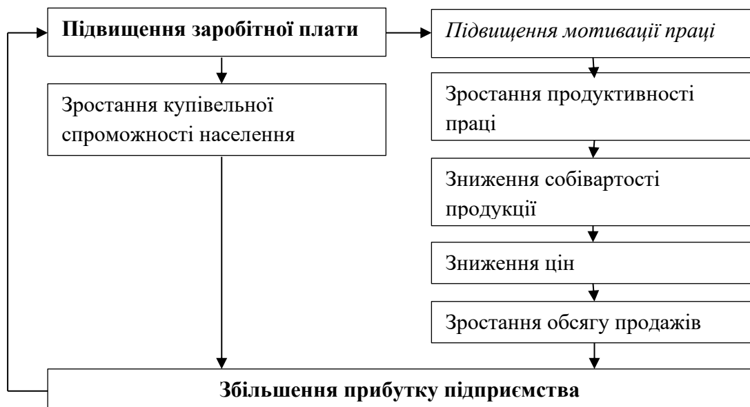
Рисунок 1.3 - Взаємозв'язок заробітної плати, ефективності та доходів