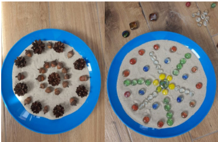
Рис.5. Мандала на піску

є опорою для нього. Після обговорення клієнт створює за допомогою круп та закріплюючого матеріалу (клей, пластилін) насипну мандалу. При цьому він робить концентричні кола, кожне з яких символізує певну життєву опору. Далі можна прикрасити мандалу на свій смак, додати симетрії тощо. Коли клієнт завершив роботу з мандалою, відбувається обговорення відчуттів, які супроводжували його під час створення мандали на момент завершення. Можна зробити невеличку медитацію, коли клієнт дивлячись на свою мандалу сили, уявляє як всі ці концентричні кола оживають та захищають та зміцнюють його і допомагають вистояти у складній ситуації.