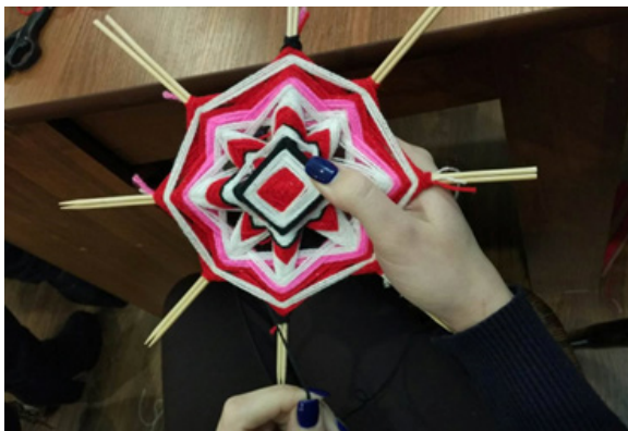
Рис.4. Плетена мандала Мандала в символдрамі (кататимно-імагінативній терапії)

Класичним варіантом створення мандали вважається малювання чи розфарбовування за заданим шаблоном. Проте нині існує величезна кількість інших способів створення мандали: мандали на піску, насипні мандали з кольорової солі та кольорового тіста, плетені з ниток, фототерапія за допомогою зображень мандал, візуалізація мандали (символдрама), метафоричні карти із зображенням мандал. Деякі з цих технік описано нижче.