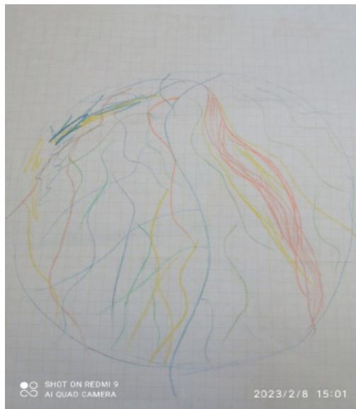
Рисунок 2. Мандала дівчини 17 років з ознаками підвищеної тривожності

Мандали клієнтки промальовані звивистими, рваними лініями, що свідчить про емоційне, інтуїтивне сприйняття світу клієнтки. По мірі роботи з клієнткою її психоемоційний стан покращився. Стабілізувалась ситуація з навчанням, дівчина визначилась, що незабаром, при досягненні повноліття спробує познайомитись з батьком.