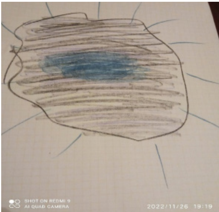
Рис.3. Мандали дівчини 20-ти років з підвищеним рівнем агресивності

Стан переживання відчаю та гніву передає зображення мандали на рис. 3.