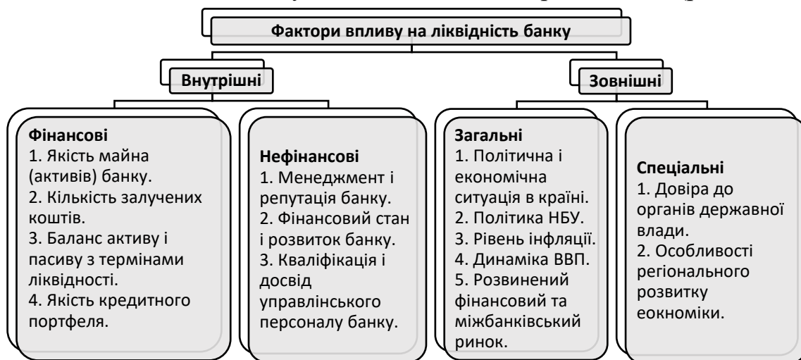
Рисунок 1 – Фактори, які впливають на ліквідність банків

На ліквідність банку впливає низка факторів. Деякі з цих факторів мають прямий вплив на ліквідність банку, тоді як інші – опосередкований (рис. 1).