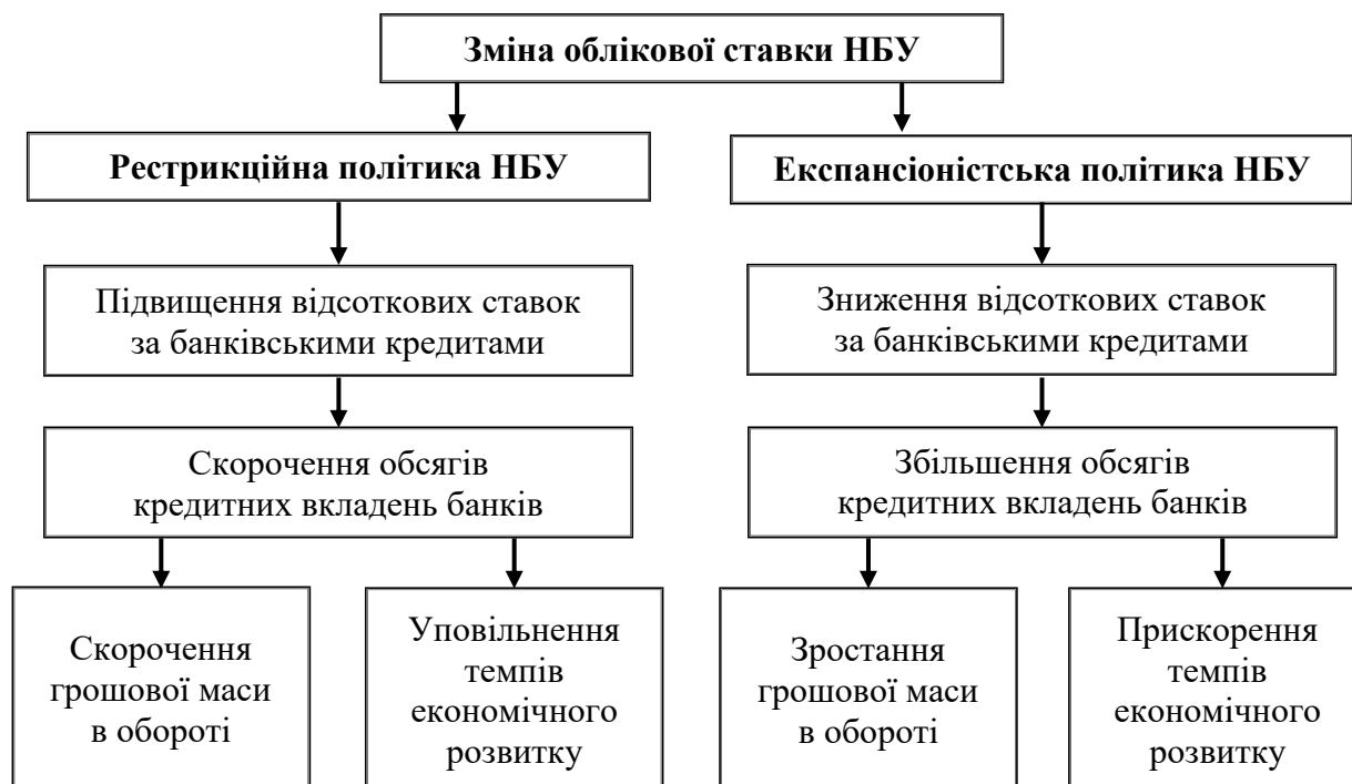
Рисунок 1.2 – Вплив зміни облікової ставки НБУ на рівень позичкового процента банків, грошову масу та економіку країни

Діаграма – один із засобів графічного зображення залежності між величинами. Діаграми складаються для наочності зображення й аналізу масових даних. Наприклад: