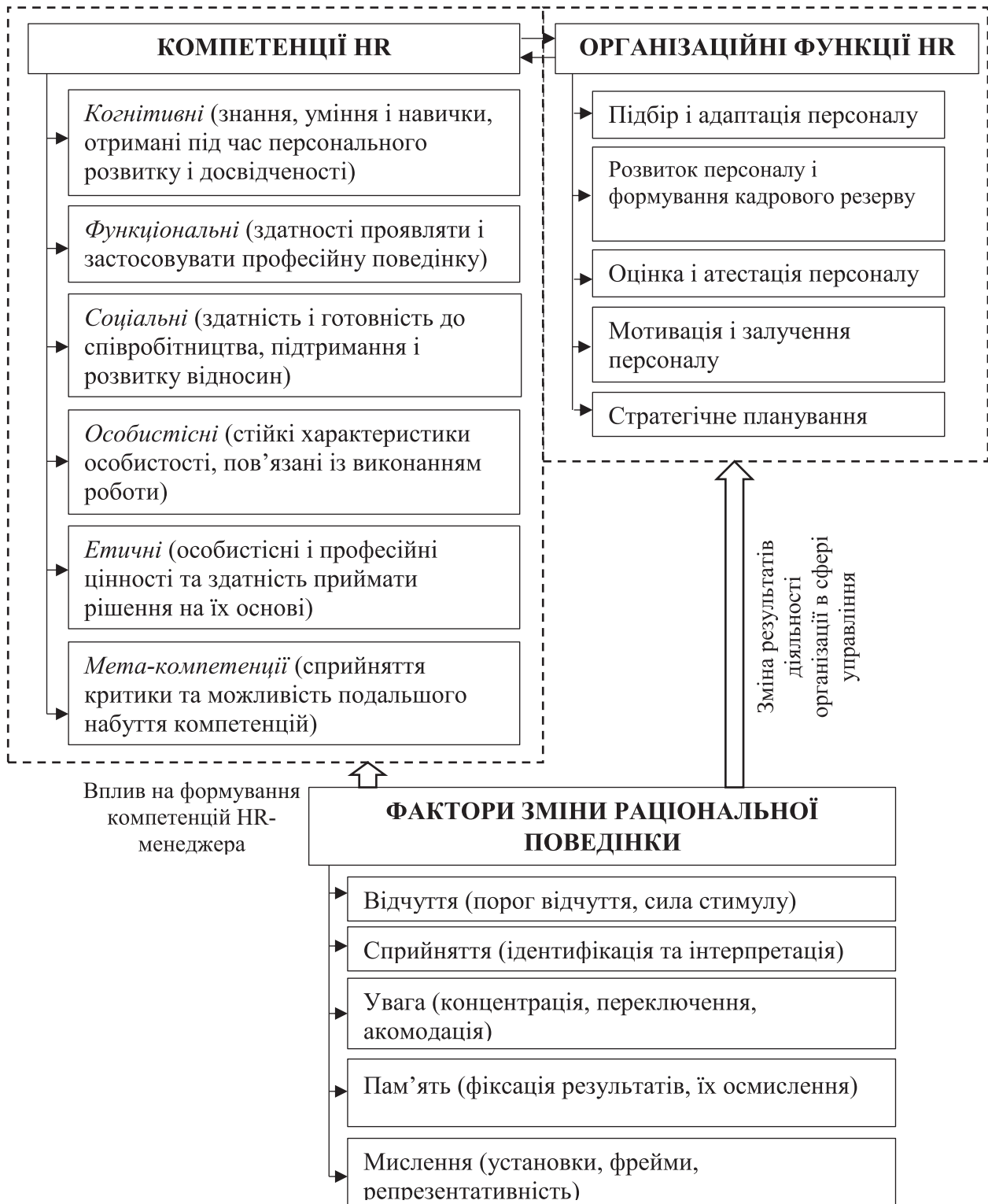
Рис.1. Модель синхронізації організаційних функцій управління персоналом, компетенцій та факторів зміни раціональної поведінки HR-фахівця