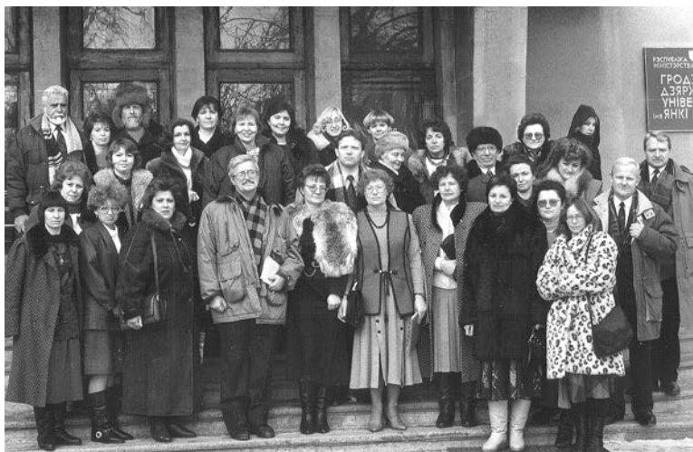
Участники VI Карских чтений, 25–26 января 1996 г., г. Гродно