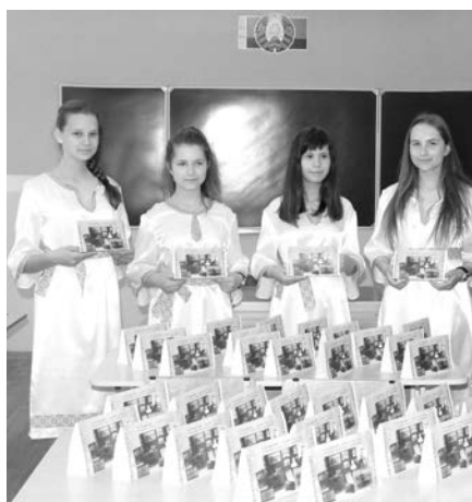
Сувениры от учащихся Луцковляннской СШ на память участникам Карских чтений