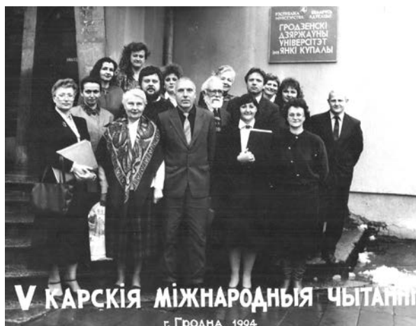
V Карские чтения, 14 декабря 1994 г., г. Гродно.