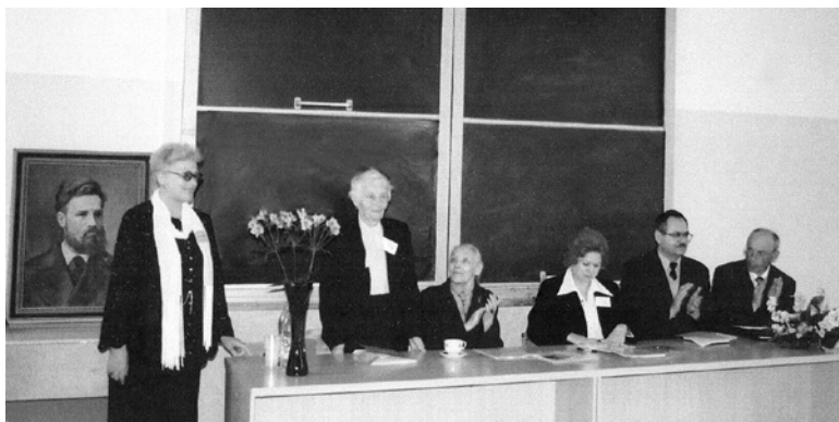
Открытие X Карских чтений, 16 мая 2005 г., г. Гродно.