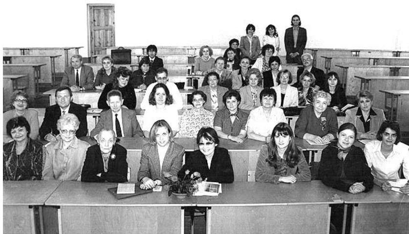
Участники X международных Карских чтений «Е. Ф. Карский и современное языкознание», 16–17 мая 2005 г., г. Гродно