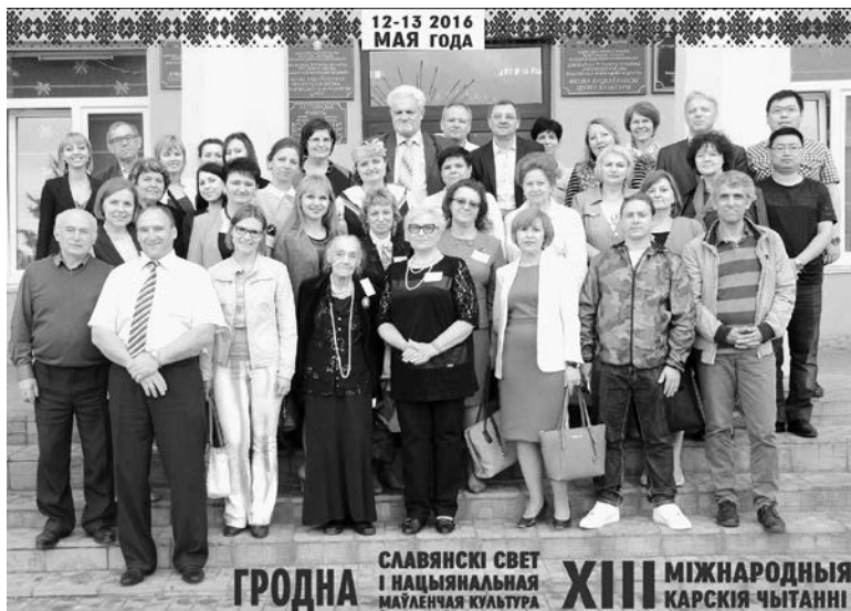
Учаснікі XIII Карскіх чтэнняў на малой радзіне Е. Ф. Карскага, 13 мая 2016 г., СПК ім. Дзеньшыкова, Гродзенскі раён