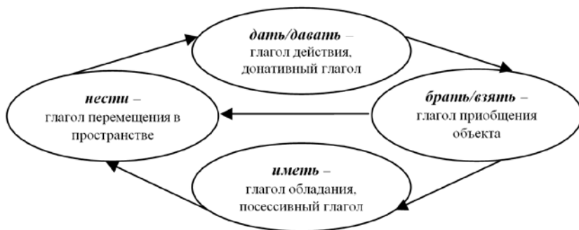
Рисунок 1 – Схема семантического соотношения компонентов ЛСП

Семантическое соотношение компонентов нашей ЛСП можно представить в виде схемы.