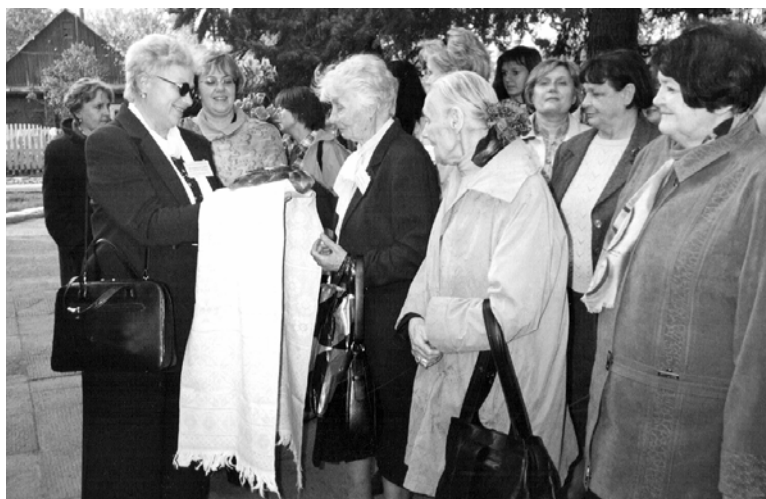
Участников X международных Карских чтений встречают хлебом-солью на родине академика Е. Ф. Карского 16 мая 2005 г.