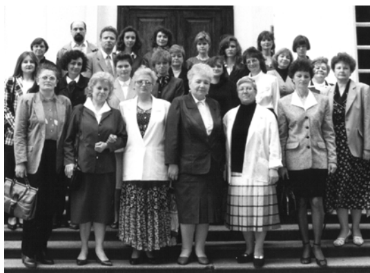
VII Карские чтения, 13–14 мая 1998 г., г. Нежин (Украина).