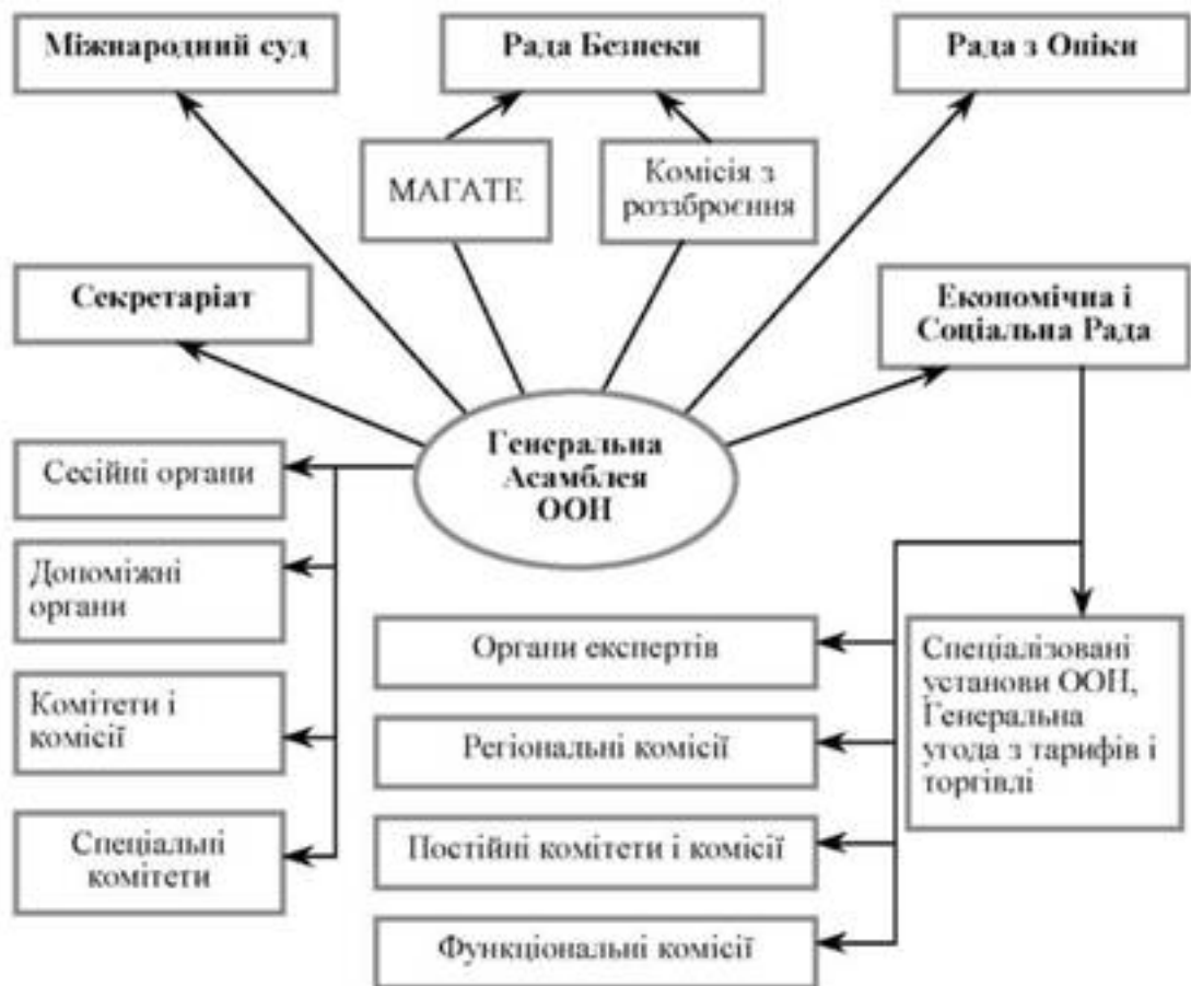
Рис. 2.1 - Структурна побудова системи Організації Об'єднаних Націй