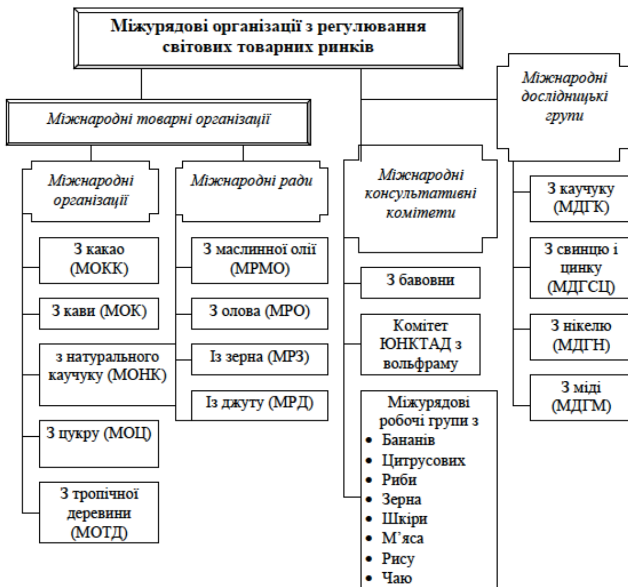
Рис. 6.2 – Типізація міжурядових організацій з регулювання світових товарних ринків

Організаційна структура міжнародних товарних організацій однотипна і включає Міжнародну раду, Виконавчий комітет і Виконавчого директора. Міжнародна рада (вищий орган) складається з представників усіх учасників Угоди. Вона проводить регулярні чергові й позачергові сесії, на яких приймаються рішення, пов'язані з реалізацією Угоди.