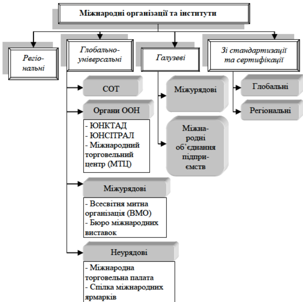
Рис. 6.1 – Система міжнародних організацій з регулювання світової торгівлі